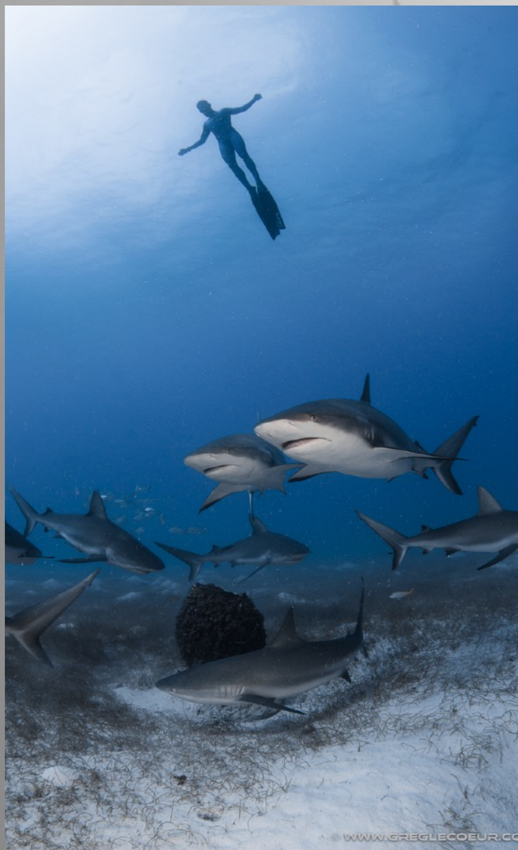
Stage apnée dans les Caraïbes.